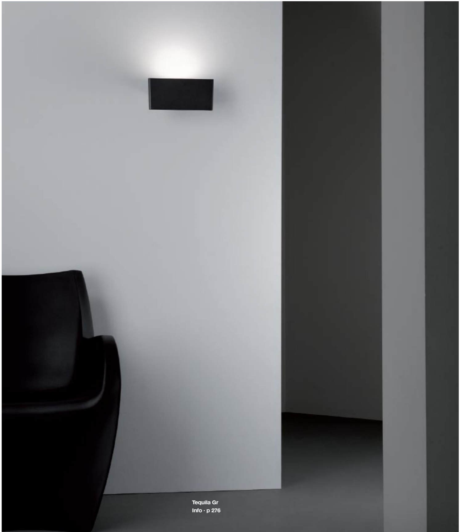
Tequila Gr Info · p 276

Struttura in alluminio pressofuso laccato bianco o grigio grafito.